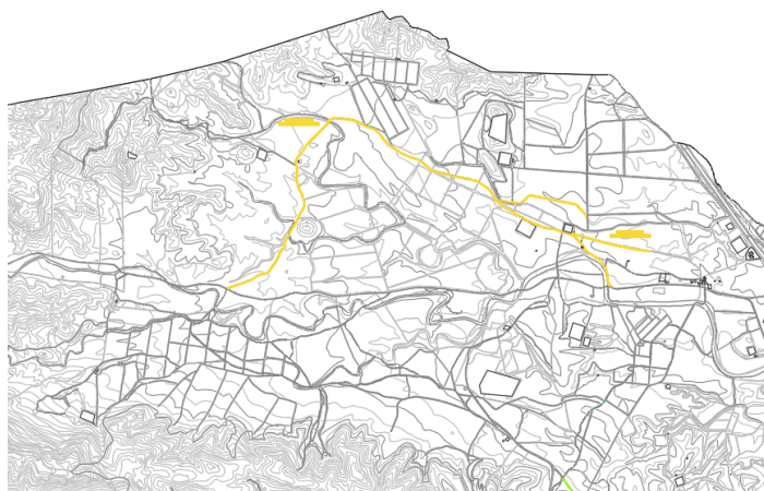
Camino de Los Cortijos a La Torre