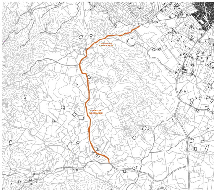
Camino de Fuente Abad