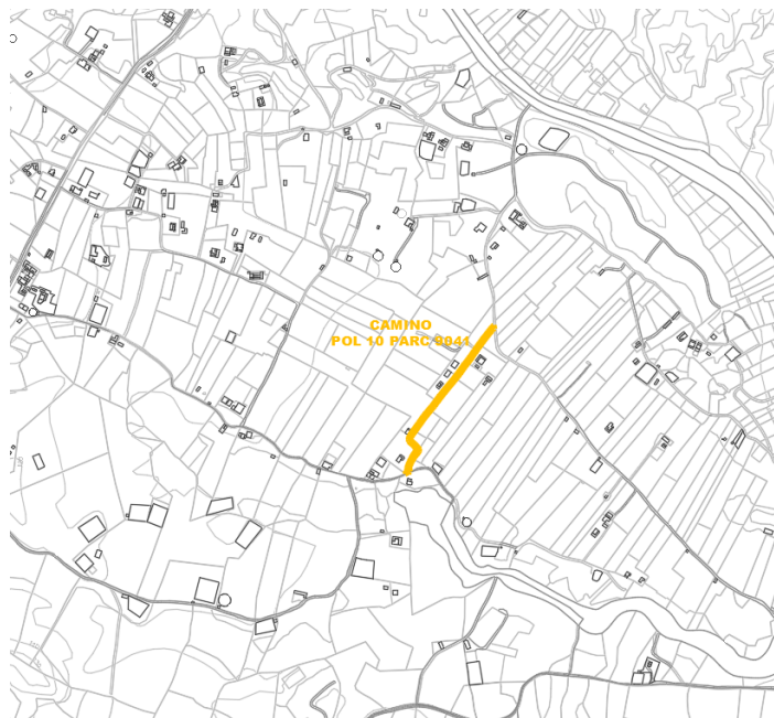
Camino Pol 10 Parc 9041