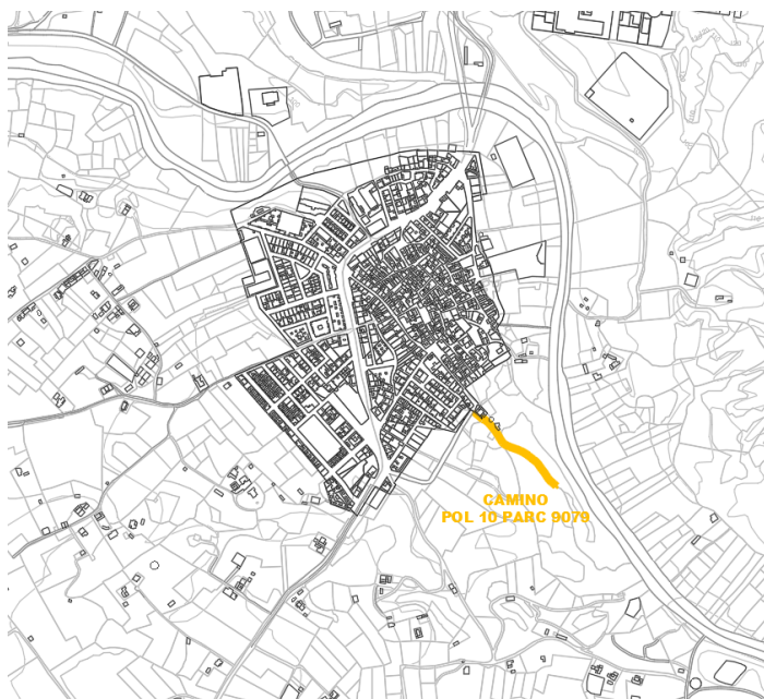
Camino Pol 10 Parc 9079