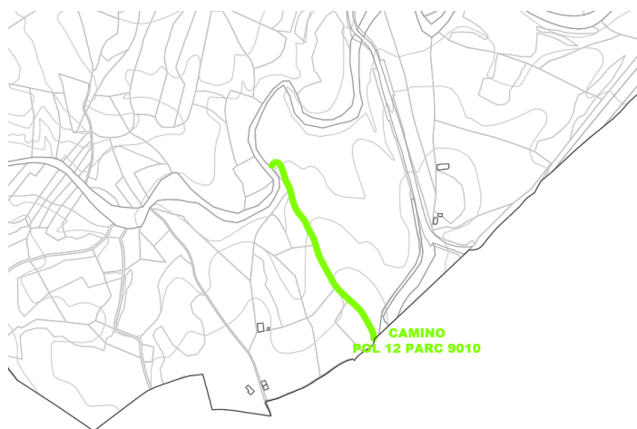
Camino Pol 12 Parc 9010