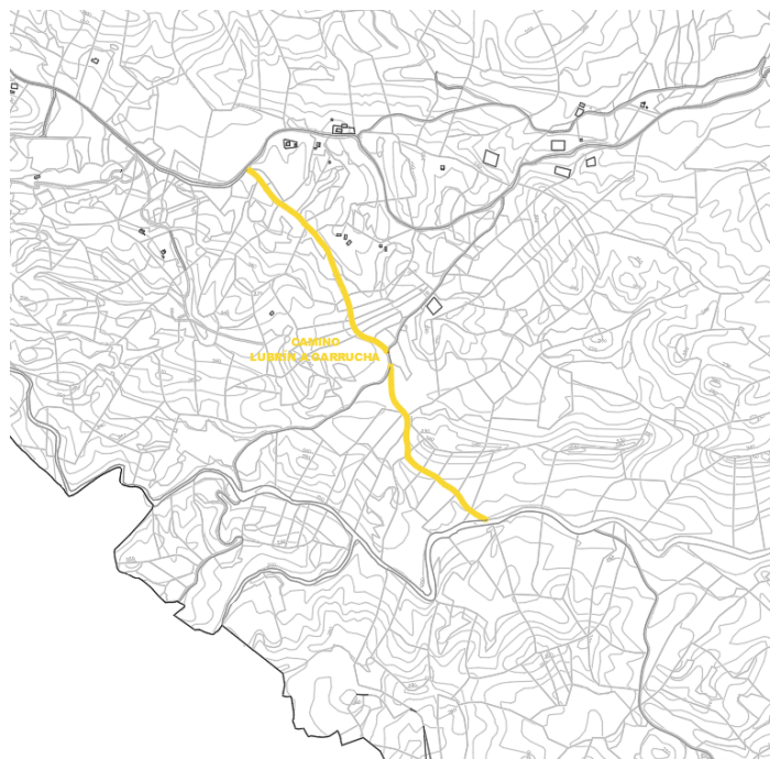
Camino Lubrín a Garrucha