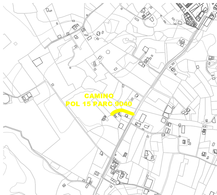
Camino Pol 15 Parc 9040