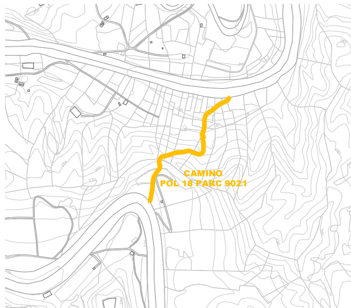
Camino Pol 18 Parc 9021