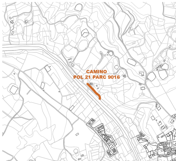
Camino Pol 21 Parc 9016