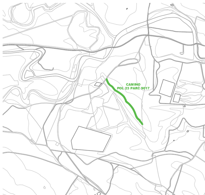
Camino Pol 23 Parc 9017