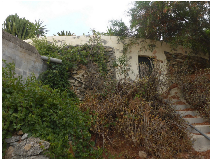
Depósito de agua 1 Barriada de los Raimundos