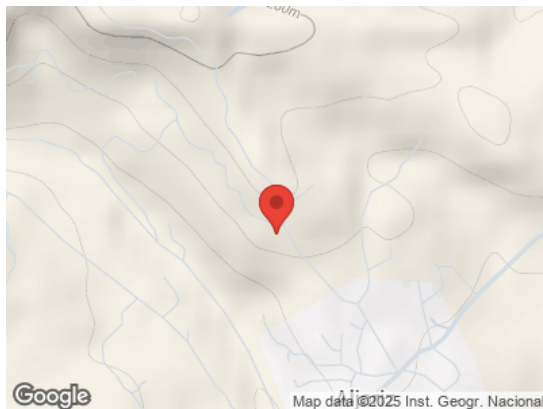
Map data ©2025 Inst. Geogr. Nacional Vista General (Terreno)