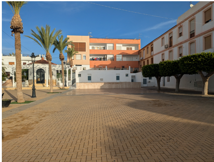
Servicios y vestuarios en la Era del Lugar