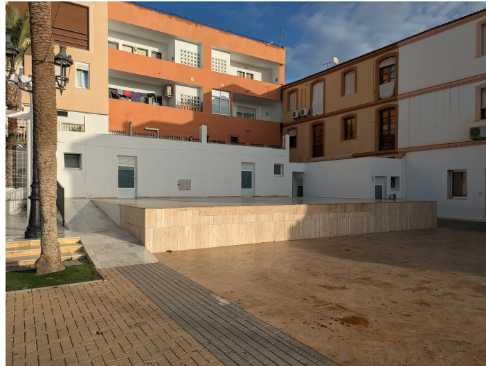
Servicios y vestuarios en la Era del Lugar