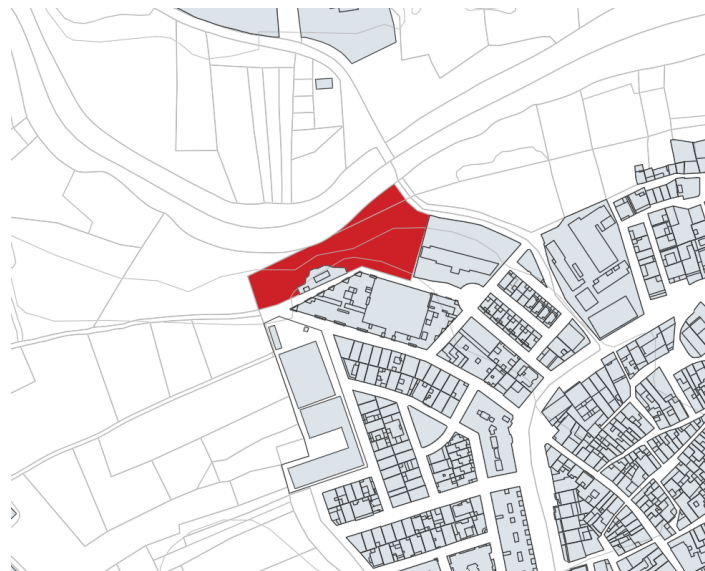
Finca rústica en Mendras Camino Noria Blanca