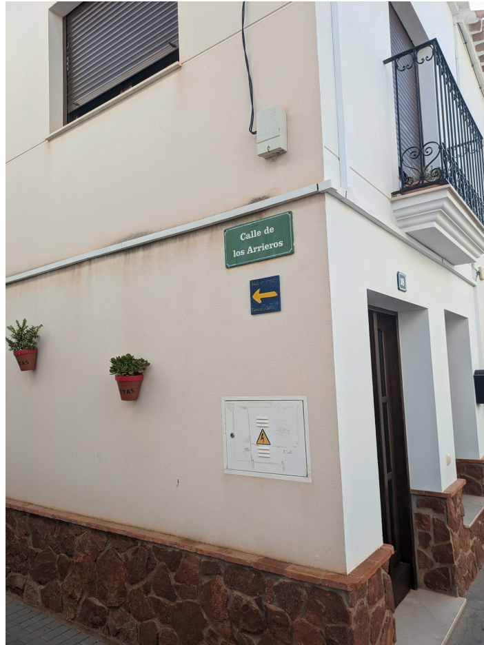
Calle de los Arrieros