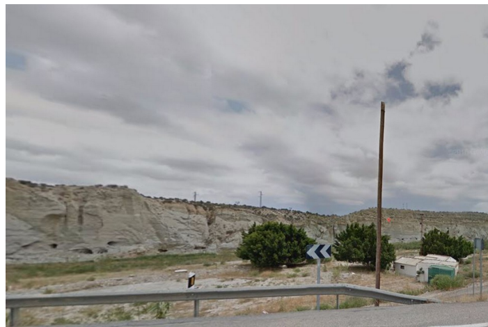
Terreno Campo Fútbol Viejo