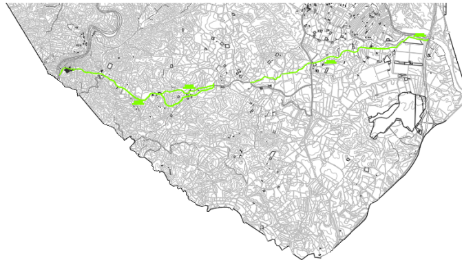
Camino de Lubrín a Vera