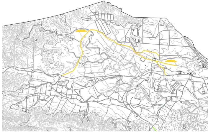
Camino de Los Cortijos a La Torre