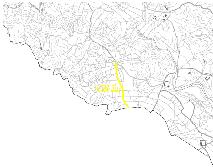
Camino de Los Raimundos a Los Gallardos