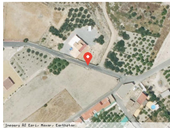
Vista Satélite (Zoom)