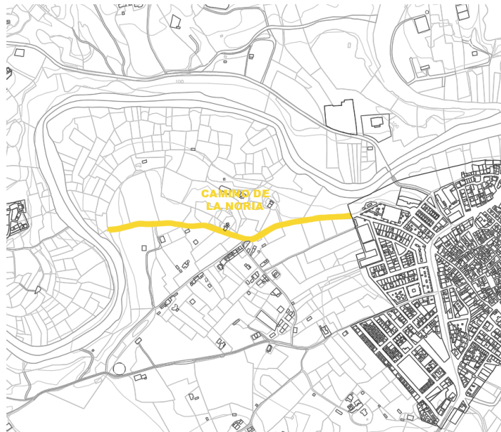
Camino de La Noria