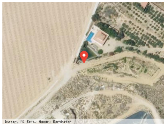
Vista Satélite (Zoom)