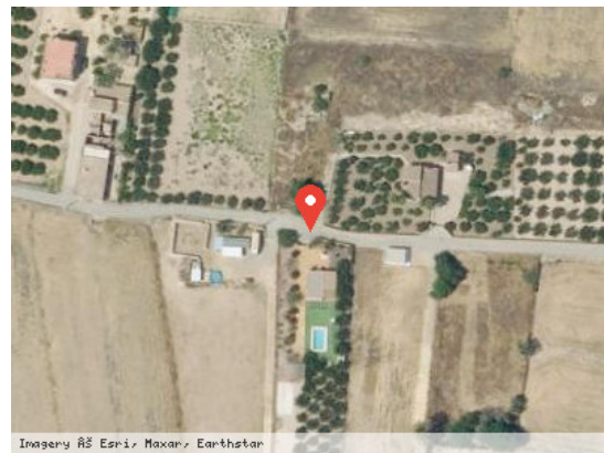
Vista Satélite (Zoom)