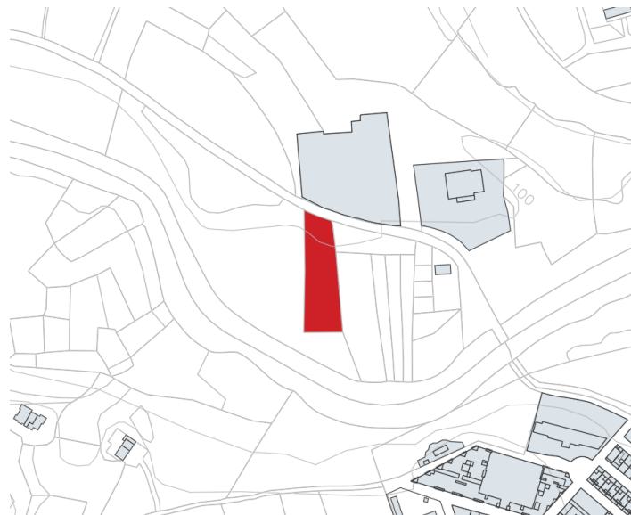
Finca rústica Polígono 8 Parcela 50, Casqueles, Antas (Almería)