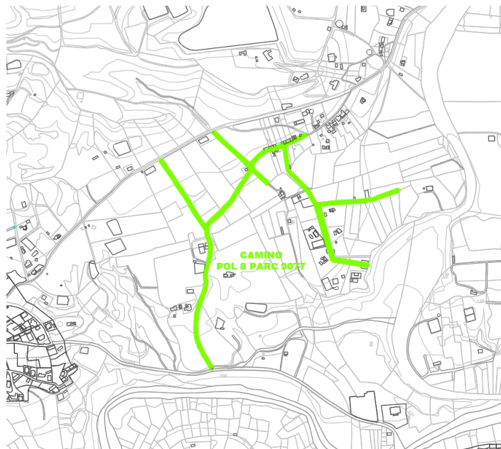
Camino Pol 8 Parc 9077