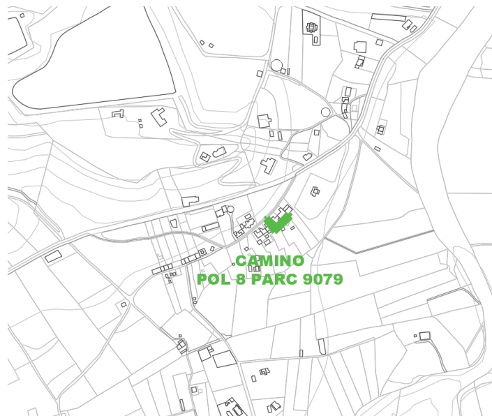
Camino Pol 8 Parc 9079