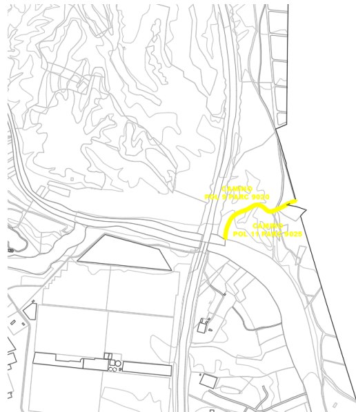
Camino Pol 9 Parc 9020 y Pol 11 Parc 9025