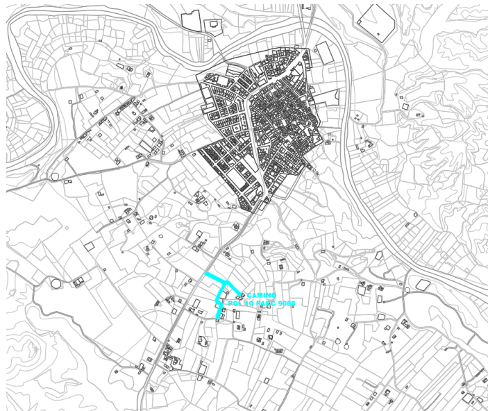
Camino Pol 10 Parc 9088