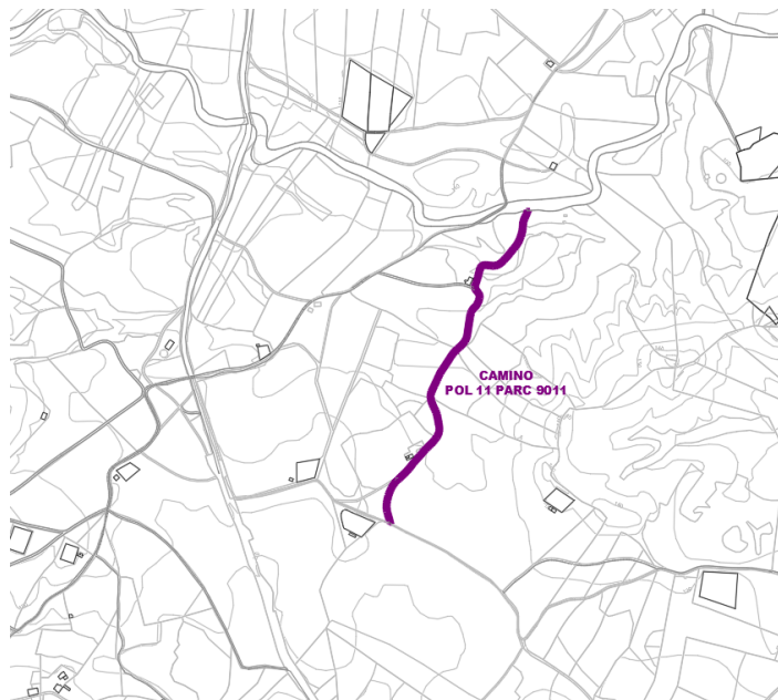
Camino Pol 11 Parc 9011