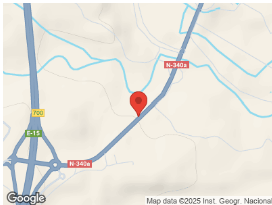
Map data ©2025 Inst. Geogr. Nacional Vista General (Terreno)