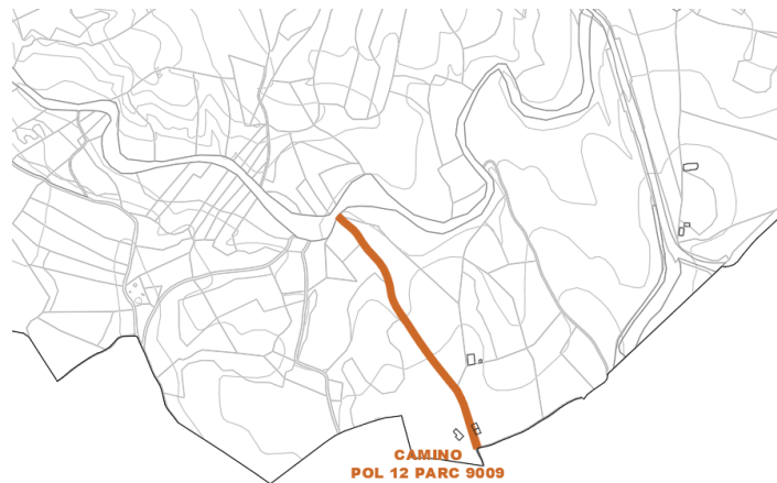
Camino Pol 12 Parc 9009