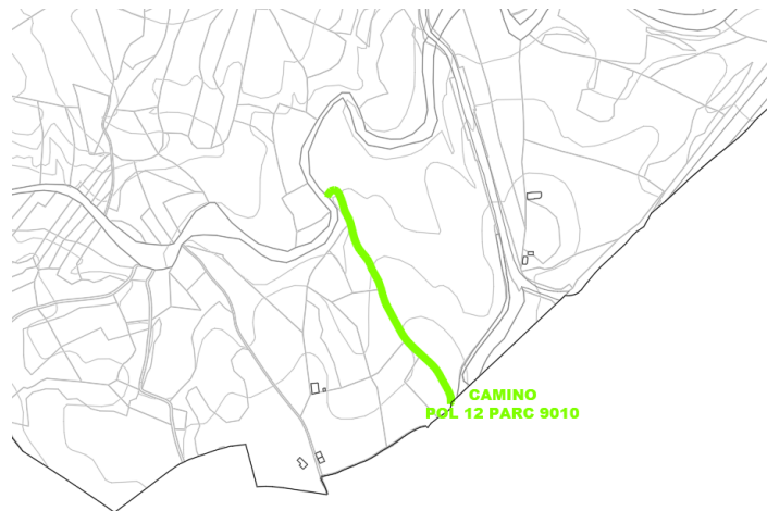
Camino Pol 12 Parc 9010