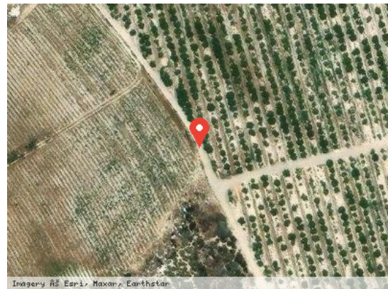
Imagery © 2025 Earthstar, Maxar, Earthstar Vista Satélite (Zoom)