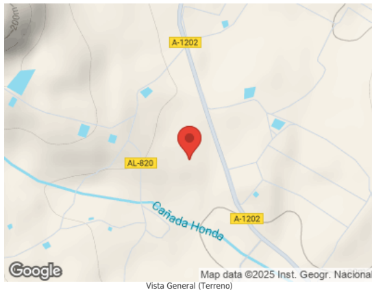
Map data ©2025 Inst. Geogr. Nacional Vista General (Terreno)