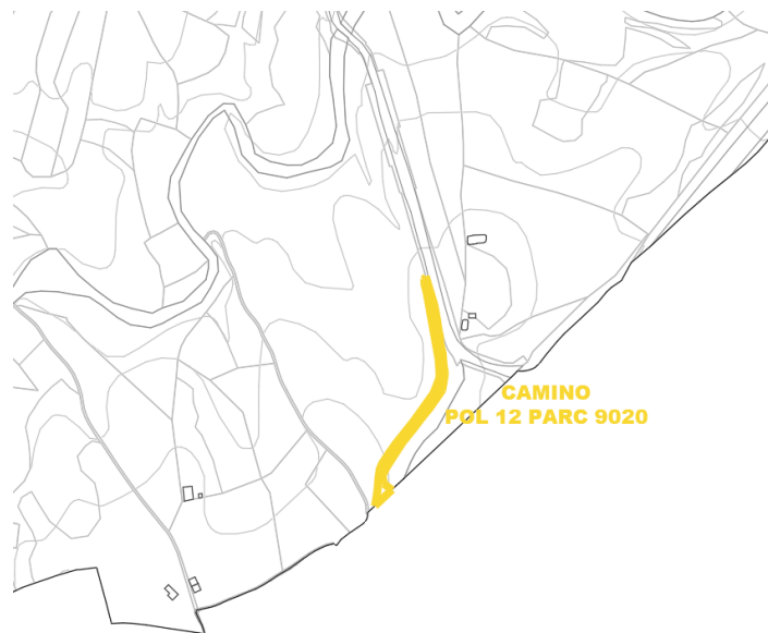
Camino Pol 12 Parc 9020