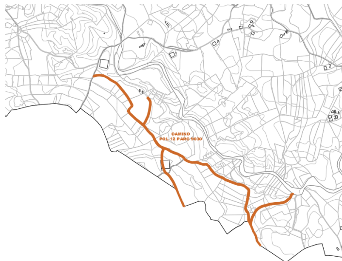
Camino Pol 12 Parc 9030