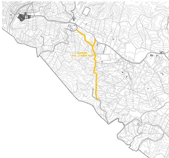
Camino Pol 13 Parc 9010