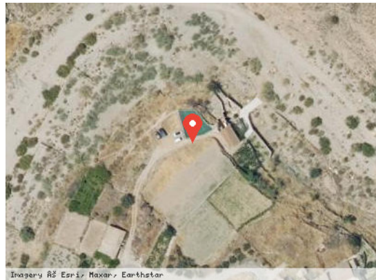
Vista Satélite (Zoom)