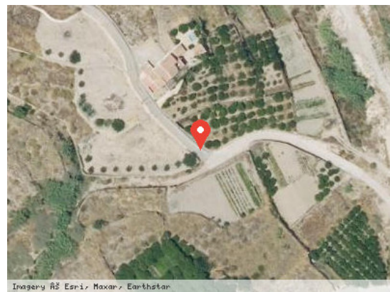
Vista Satélite (Zoom)