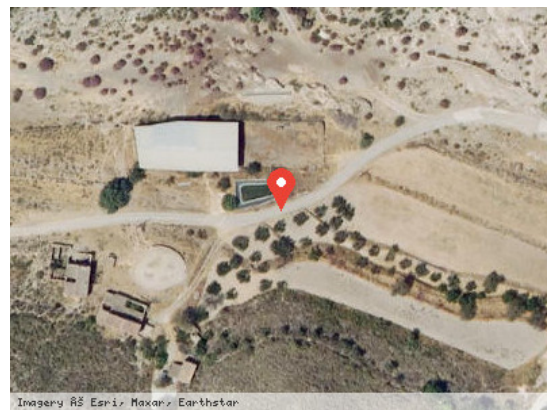
Vista Satélite (Zoom)