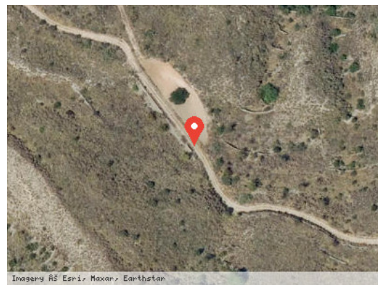
Vista Satélite (Zoom)