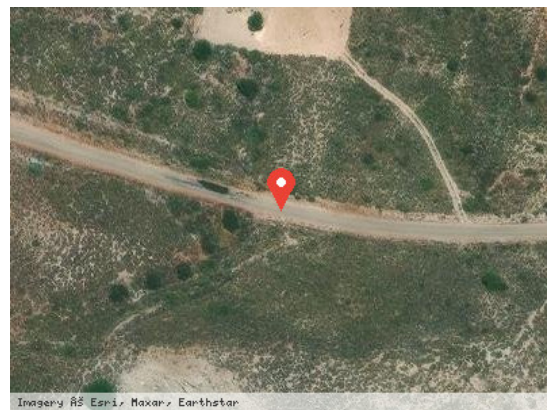
Vista Satélite (Zoom)