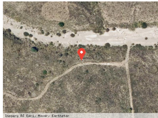
Imagery ©2025 Esri, Maxar, Earthstar Vista Satélite (Zoom)