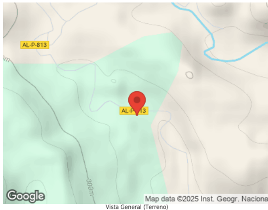
Map data ©2025 Inst. Geogr. Nacional Vista General (Terreno)