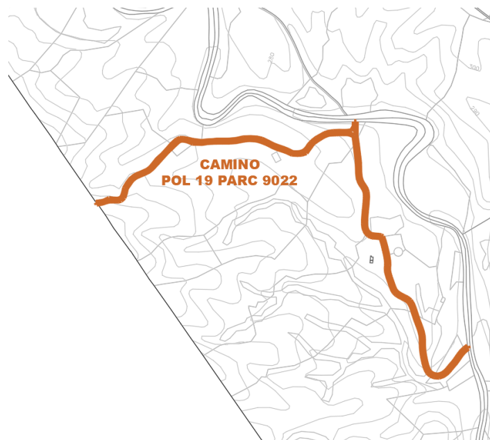
Camino Pol 19 Parc 9022