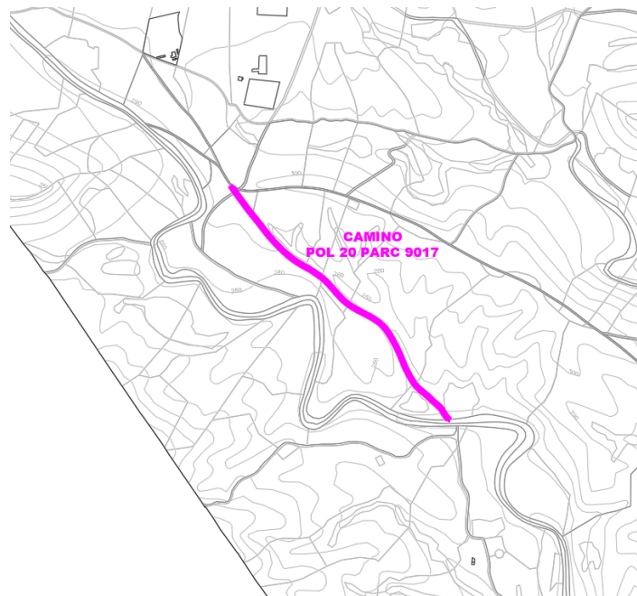
Camino Pol 20 Parc 9017