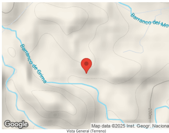
Map data ©2025 Inst. Geogr. Nacional Vista General (Terreno)