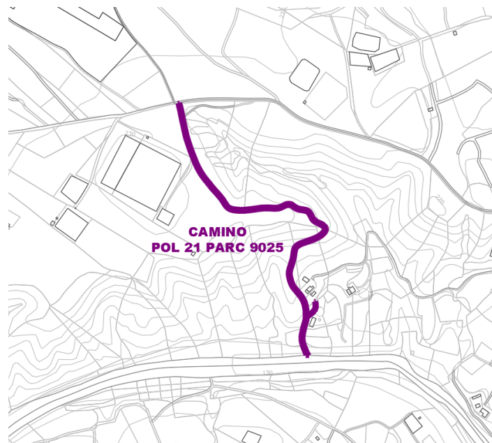
Camino Pol 21 Parc 9025