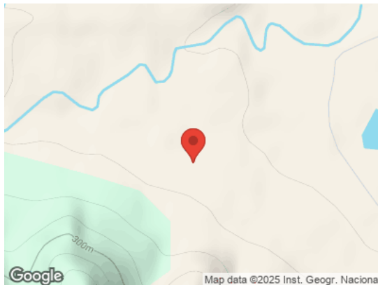
Map data ©2025 Inst. Geogr. Nacional Vista General (Terreno)