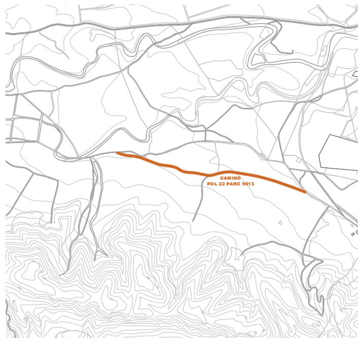
Camino Pol 22 Parc 9013