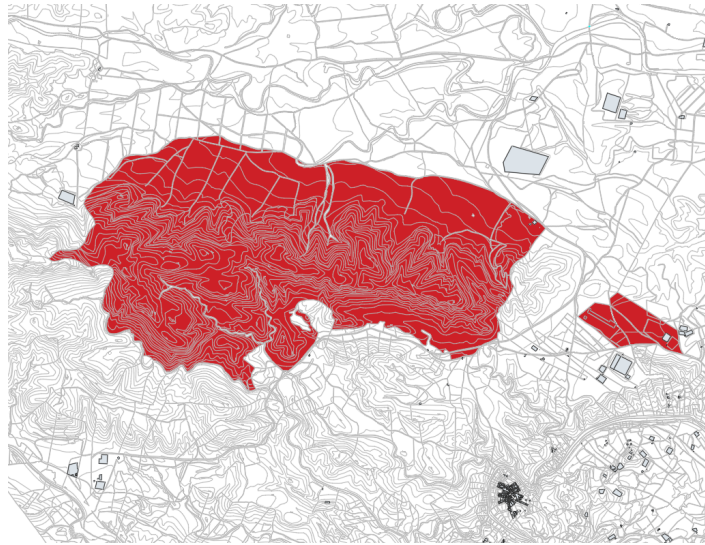
Monte Caballón y Campo de la Ballabona