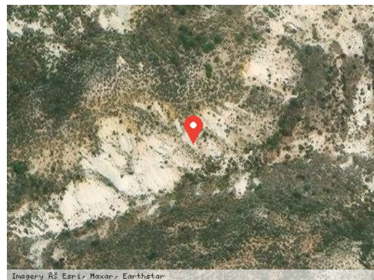
Vista Satélite (Zoom)