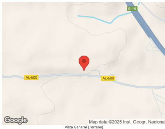
Map data ©2025 Inst. Geogr. Nacional Vista General (Terreno)